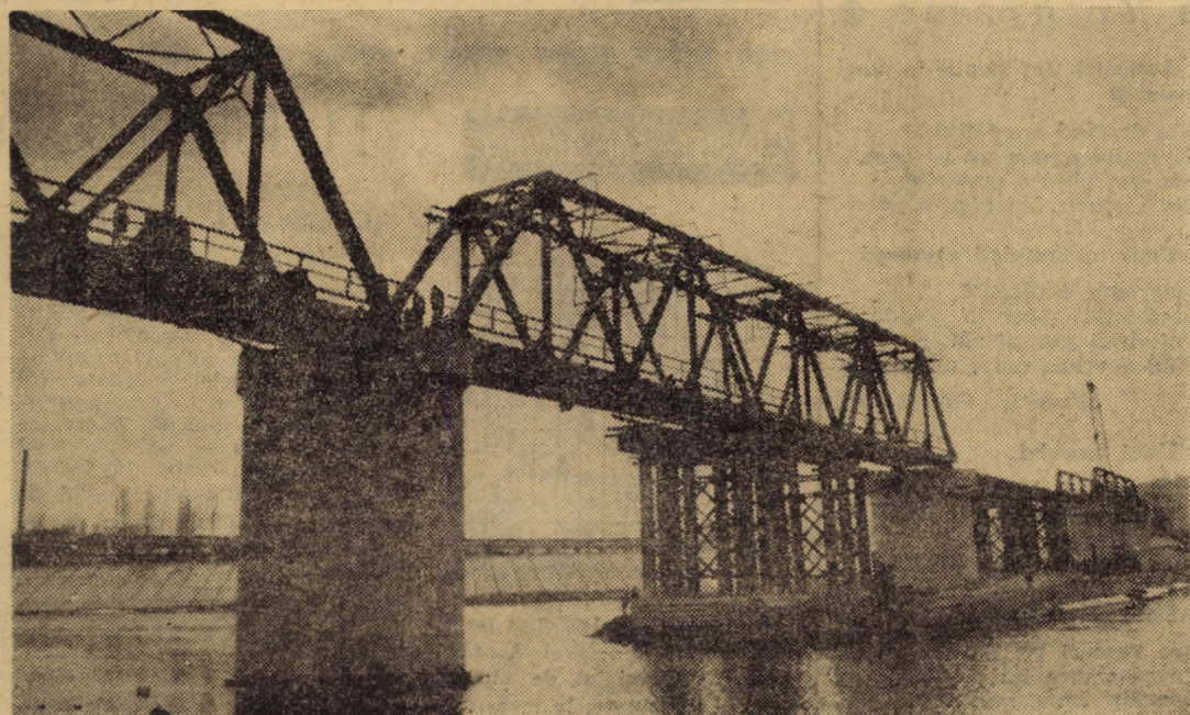
Lansarea tablierului principal s-a încheiat cu succes! O nouă cale de oțel unește acum malurile Oltului.