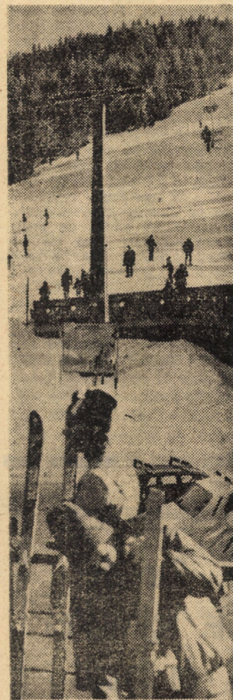
Stațiunea Păltiniș. Partea din Oncești — (încă) un adevărat paradis al schiorilor

Privind în jur totul îți pare Nemărginită încîntare Simți că-ți suride viitorul Mărțișorul. Traian DRAGOSIN