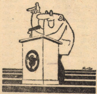
Desen de Rudi SCHMUCKLE

8,0 trî țam Alm 9,00 9,30 10,00 11,45 13,00 cal. Fotk opti „Cuj Spai 17,00 lor Din Cale nal, pei hand priza nica naur Micu cei jurn prin gistr Sele curs muzi neas 20,15 Cicu nimi mier Intil pere Tele 15. Trag zare misit ghia nal. cinst tic. nico Roma vesti țară. diou 22,00 SI „Ple orele 16; „Sec 12; 20,30 „Fiul rele echip pore 20. I fari I 16; 1 ME sul: front serii, 14; tului 10; I.L. xand orele CIS secol 11; 1 Du servi cu, în uă z relat mai incep munt soare slab din rile r prins grad, între Strat șoară cm, 290 c