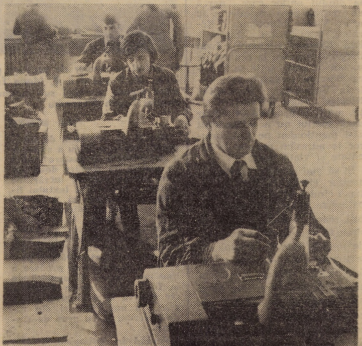
Una din benzile de lucru de la unitatea de marochinărie din Săliște aparținînd întreprinderii „13 Decembrie” Sibiu