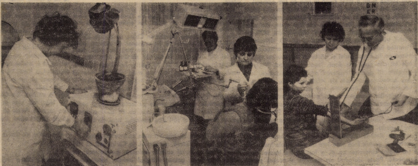
Citeva imagini care vorbesc, concret, despre grija față de om