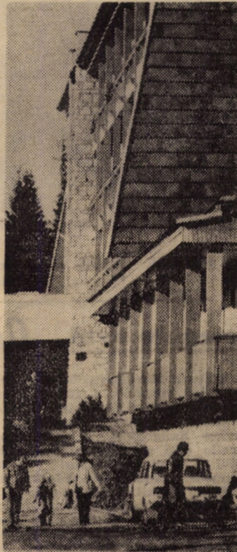
Hotelul „Cindrelul” din stațiunea climaterică Păltiniș