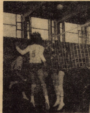
Aspect din partida de volei feminin Textila Cisnădie — I.J.G.C.L. Brașov, încheiată cu victoria categorică (3-0) a gazdelor.

EFICIENȚA — criteriul esențial de apreciere a calității muncii organizatorice