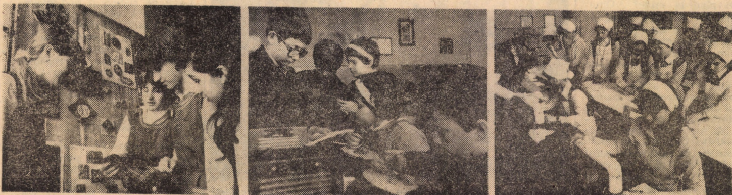
La Școala generală nr. 19 din Sibiu, elevii, grupați în diferite cercuri aplicative, desfășoară o vie activitate. În fotomontajul de mai sus vă prezentăm trei imagini din cercurile de ceramică și desen, de pirogravură și din atelierul de croitorie-gospodărie.

14,00 sita F.G. Mec U.E. 15,50 noe 16,00 16,05 gog 16,30 17,00 miel 17,45 20,00 20,15 ideo 20,30 terp 20,45 „Pia lui” 22,15