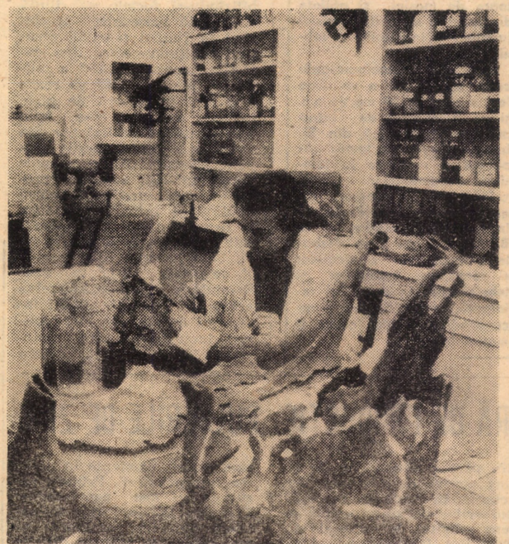
La Muzeul de științe naturale din Sibiu se desfășoară o activitate neîntreruptă, plină de conștiințozitate și pasiune, avînd ca rezultat o continuă creștere a patrimoniului muzeal. Astfel, numai din anul 1980 colecțiile au fost îmbogățite cu un număr de peste 79 000 piese diferite. În laboratorul secției - de unde vă redăm imaginea - au fost restaurate și preparate, în aceeași perioadă de timp, peste 325 piese diferite din colecția muzeului.