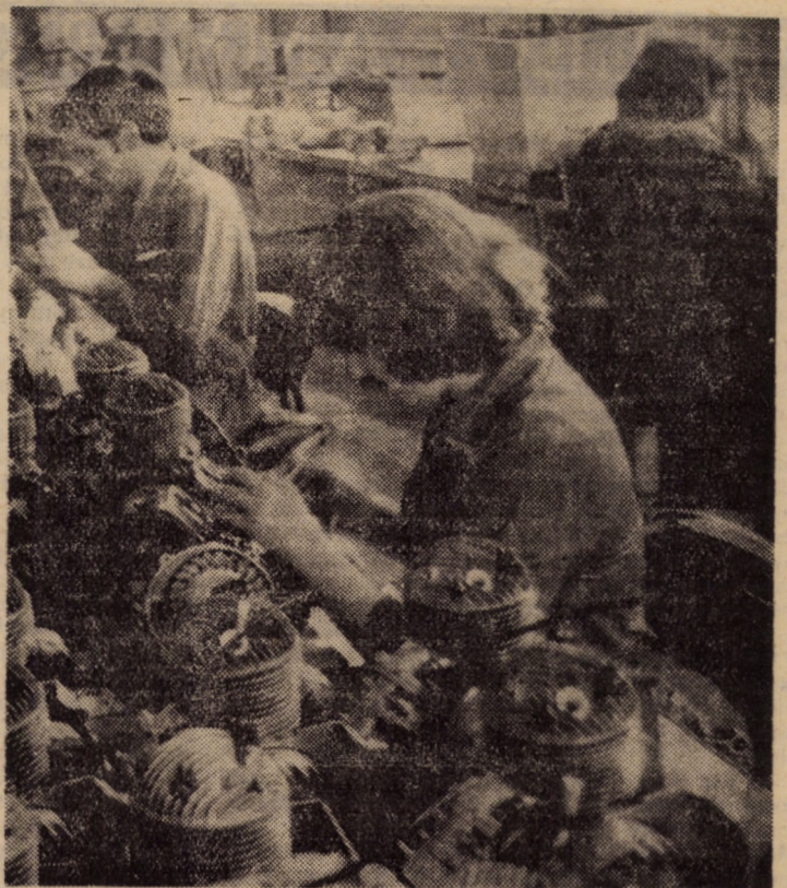
Hărnicie, disciplină, conștiinciozitate — atribute ale tinărului colectiv de muncitori din secția montaj motofierăstrăie de la I.U.P.S. Sibiu

● CE SPUN OAMENII? Spun că, deși au obținut rezultate care-i onorează, nu sînt pe deplin satisfăcuți, că, dintr-un motiv sau altul, nu și-au făcut datoria cu prisosință, ceea ce a împietrit nivelurile calitative și cantitative ale muncii lor. Și, pentru că dorința lor primă și fermă este să diminueze pe cât cu putință propriile lipsuri, au pus, fără teamă, degetul pe rană, sperind chiar într-o potențială eradicare a acestora. Toți care au vorbit — și au fost neașteptat de mulți — au vorbit cu „Condică de serviciu” în față, un fel de „Cartă” a muncii lor de fiecare zi. Deci, ce-și impută personalul silvic, brigadierii și pădurarii? Activitatea de dezvoltare, apărare și consolidare a patrimo-