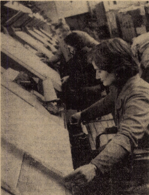
Controlul finit al țesăturilor în secția finisaj a întreprinderii „Tirnavă” Medias.