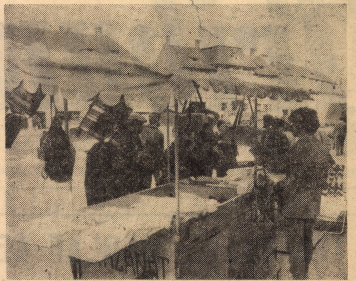
Odată cu instalarea primăverii, în fața magazinelor de pe străzile municipiului Sibiu au apărut și tonetele pentru comerțul stradal

Comisia județeană pentru turism a C.J.E.F.S. Sibiu, care asigură desfășurarea tehnică a probei, prezăvute, organizează cu această ocazie și înfîlțirea trimestrială a președinților tuturor cercurilor și cluburilor de profil ca și a instructorilor-ghizi pentru turism care activează în întreprinderile și instituțiile sibiene. Vor fi analizate modalitățile de îndeplinire a obiectivelor incluse în calendarul competițional al anului în curs în scopul obținerii unor acțiuni unitare și eficiente, spre folosul maselor largi de oameni ai muncii care doresc ca, prin practicarea turismului montan de agrement, să-și petreacă în mod agreabil zilele libere și cele de la sfîrșitul de săptămîină. (A.I. C.)