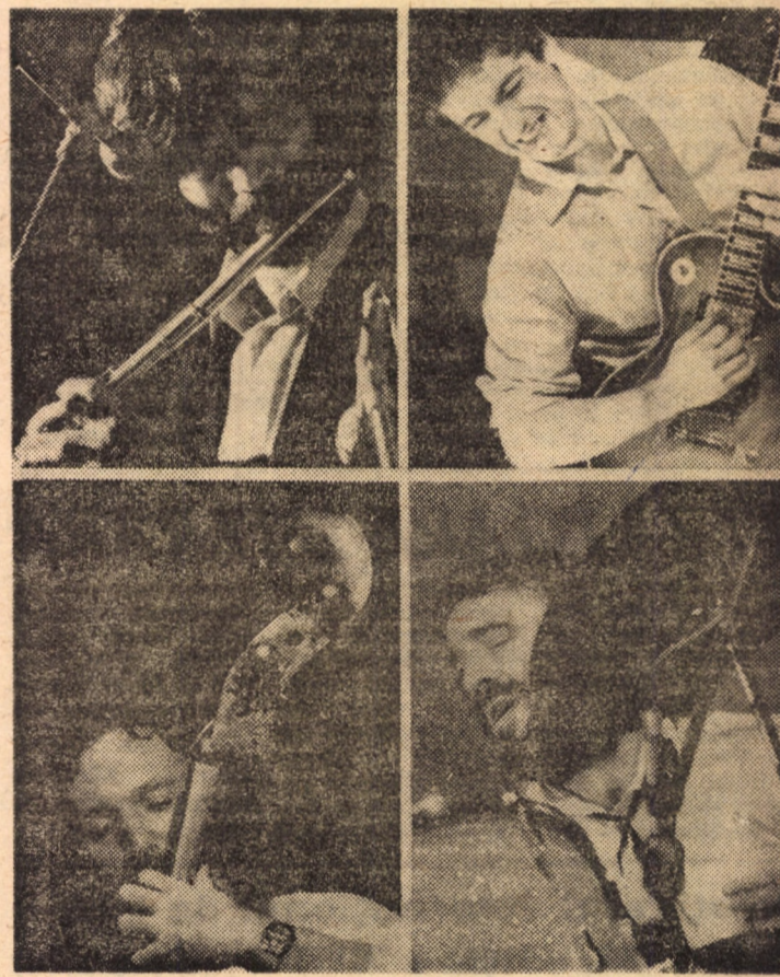
Formația „Crepuscul”, Timișoara