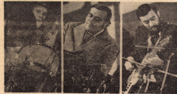
Formația Trio A.B.C. Sibiu

Cronici realizate de Virgil MIHAIU