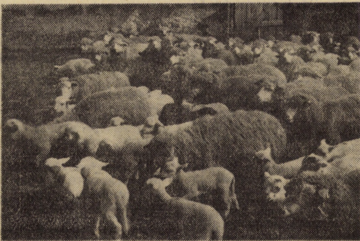
La C.A.P. Velț, preocuparea pentru sporirea efectivului este ilustrată și de cele peste 1400 fătări.

ză să fie realizat la Întreprinderea mecanică Sibiu. Prin utilizarea acestui centru de prelucrare se vor putea elimina ștanțele.