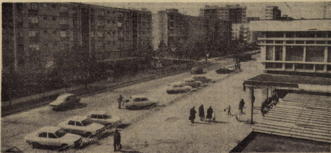
Și în această primăvară, locatarii cartierului Hipodrom din Sibiu sint preocupați de buna întreținere și înfrumusețare a spațiilor inconjurătoare ale blocurilor, tinzînd spre unul din locurile frunțase privind curățenia orașului. În fotografie: aspect de pe str. Kolarov.