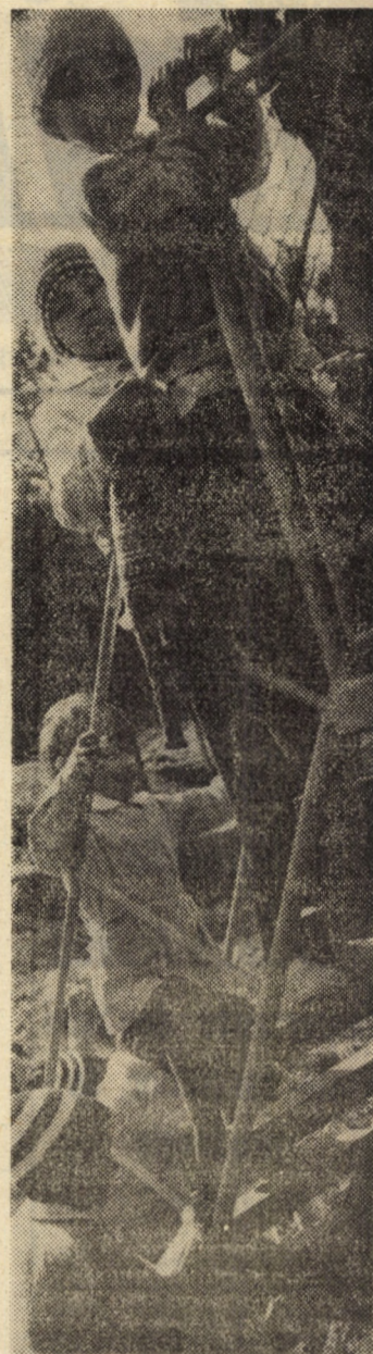
Odată cu instalarea primăverii, toboganul din curtea Grădiniței nr. 7 Cisnădie devine neîncăpător.