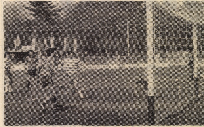
Coca egalează pentru Șoimii 1-1