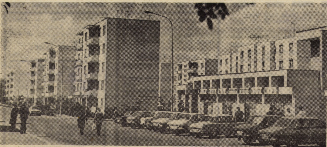
Str. Gorăslău din municipiul Sibiu — unul din locurile frumos întreținute ale cartierului Hipodrom.