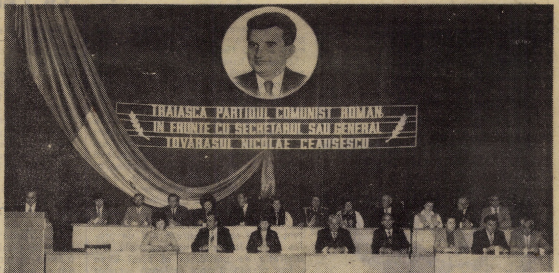
LAUDĂ MUNCII, ÎNALTĂ CINSTIRE EROILOR SĂI DE FIECARE ZI! (în pag. a III-a)