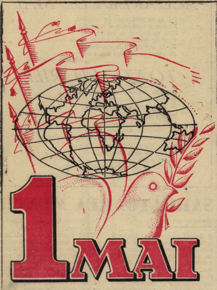
Desen de: Ștefan TANCOU