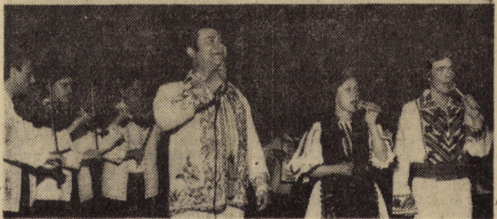
„Omagiul muncii” — iată genericul sub care s-a desfășurat emoționantul program cultural-artistic cu prilejul adunării festive de la Sibiu, consacrată sărbătoririi zilei de 1 Mai — Ziua solidarității internaționale a celor ce muncesc, ziua frăției muncitorilor de pretutindeni. Au participat formații cultural-artistice laureate ale Festivalului național „Cîntarea României”