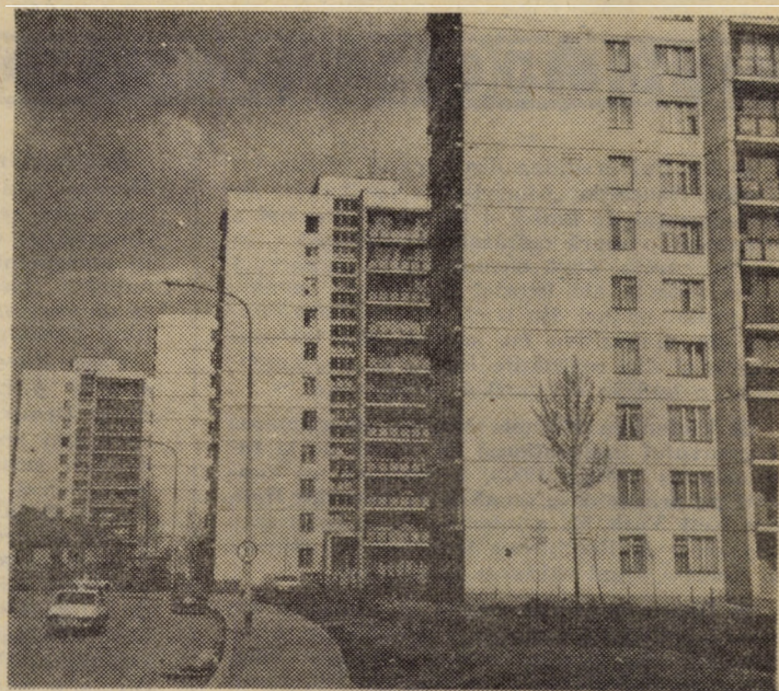
Cu aparatul de fotografiat prin cartierul Hipodrom III din Sibiu.