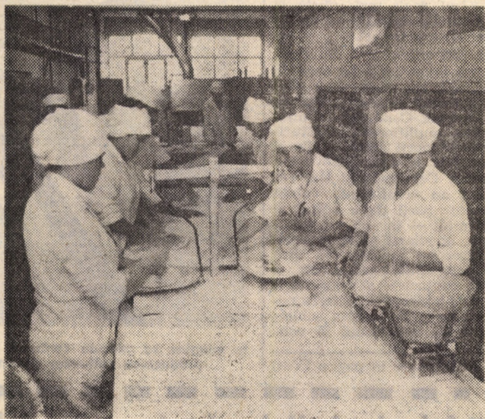
În atelierul-școală al Liceului industriei alimentare din Sibiu — o veritabilă brutărie cu o bună dotare tehnică — elevii deprind tainele meseriei sub îndrumarea cadrelor de specialitate, asigurând o piine de bună calitate

Lupu A. — Sibiu: Potrivit art. 24 din Legea 1/1977 se exceptează de la obligația de plată a contribuției, stabilită pentru persoanele fără copii, numai persoanele care au avut unul sau mai mulți copii născuți vii, decedați ulterior, precum și persoanele care au invaliditate de gradele I și II și soții acestora pe timpul cât durează invaliditatea. Legea nu face delimitarea între persoanele care nu vor să aibă copii și cele ce nu pot procrea din motive medicale.