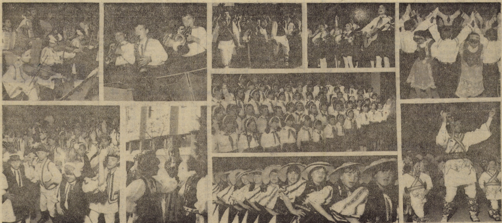
Duminică, 8 mai, formațiile artistice ale pionierilor și uteciștilor din județ au evoluat în cadrul fazei naționale a Festivalului „Cîntarea României”

La zi în agricultură Continuare în pag. a III-a) Nicolae IVAN