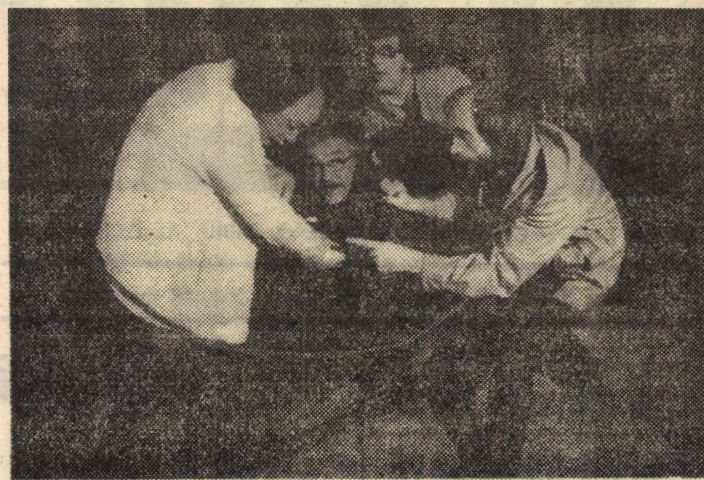
Imagine din spectacolul cu piesa „Haina cu două fete” de Stanislav Stratiev

Teatrul de stat Sibiu, prezintă în premieră, joi, 12 mai a.c., ora 19,30 spectacolul cu piesa „Haina cu două fete” de Stanislav Stratiev — comedie satirică ce vestește birocrația cu toate consecințele ei nefaste.