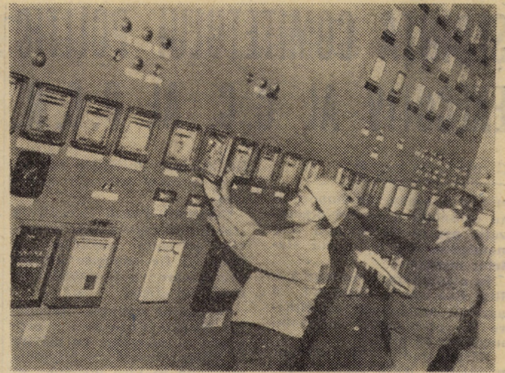
Supravegherea parametrilor funcționali și urmărirea bunului mers al procesului de producție din camera de comandă a furnalului la I.M.M.N. Copșa Mică