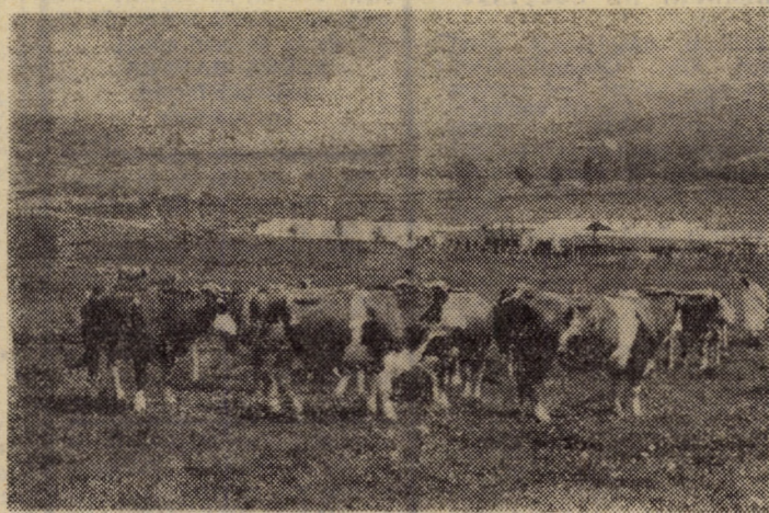
Pășunat rațional pe pășunile tarlalizate ale A.E.I. Mindra

Lucrările de ameliorare sînt susținute de unități de cercetare, testare și selecție, create și dezvoltate în mod deosebit în ultimii ani. Stațiunea de cercetare zootehnică de la Cristian și-a înscris în programul ei peste 70 de teme menite să contribuie la ameliorarea speciilor ovine și caprine. Laboratorul de selecție din cadrul Oficiului județean de reproducție controlează peste 50 la sută din efectivul de vaci, peste 40 mii oi și testează întregul efectiv de porci de reproducție de la Complexul Avrig și ferma I.A.S. Dealul Ocnei. Firește, o parte din preocupările pentru îmbunătățirea fondului genetic sînt materializate direct în unitățile de producție.