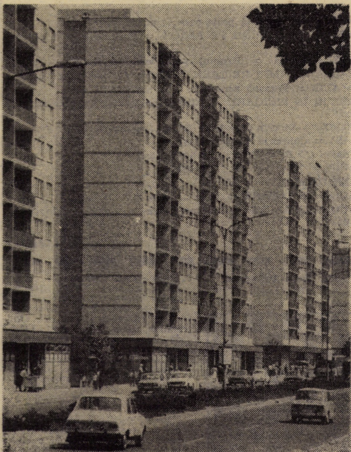
„Faguri” din beton și sticlă

(Continuare în pag. a III-a) Nicolae ACHIM