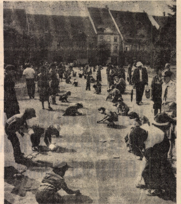
Cu cîteva cutii de cretă colorată și cu multă, multă imaginație universul copilăriei prinde contur. Piața Republicii din Sibiu a cunoscut miercuri, 1 iunie, animația proprie tradiționalului concurs de desene pe asfalt

15,00 Telex. 15,05 Consultativ pentru admiterea în învățământ superior tehnic. Chimie organică. 15,30 Emisiune în limba germană. 17,25 Tragerea loto. 17,30 La volan. 17,40 Anunțuri și muzică. 17,50 1001 de seri. 20,00 Telex. 20,15 Izvor al