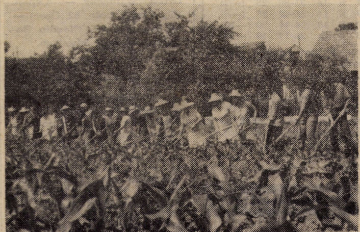
Un mod concret de a înțelege și a traduce în fapte Decizia nr. 596/1983 a Consiliului popular județean privind participarea activă a tuturor locuitorilor satelor la lucrările de sezon în agricultură. În imagine lucrătorii Cooperativei de producție, achiziții și desfacerea mărfurilor Șeica Mare la prașila porumbului.