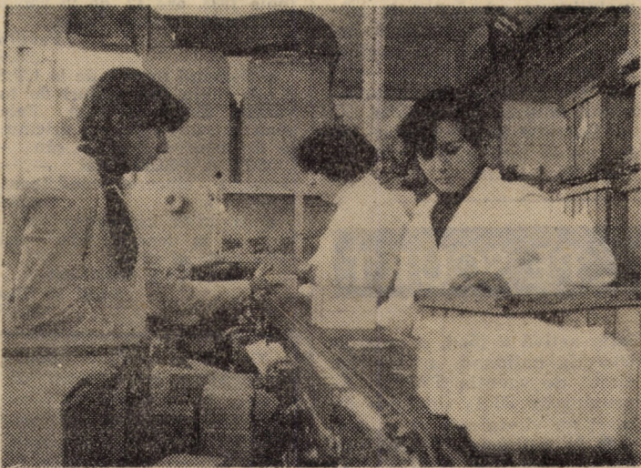
La Fabrica de săpun „Steaua” din Sibiu au fost modernizate liniile tehnologice, fapt ce a dus la sporirea productivității muncii și a favorizat îmbunătățirea calității produselor. În imagine linia de ambalare a săpunurilor