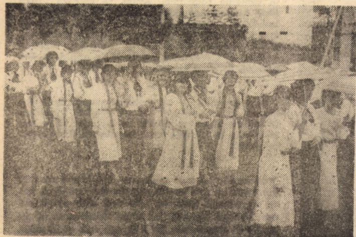
Secvențe de la cea de-a III-a ediție a Festivalului folcloric „Iubit pămînt românesc”, desfășurat duminică la Cîsnădioara