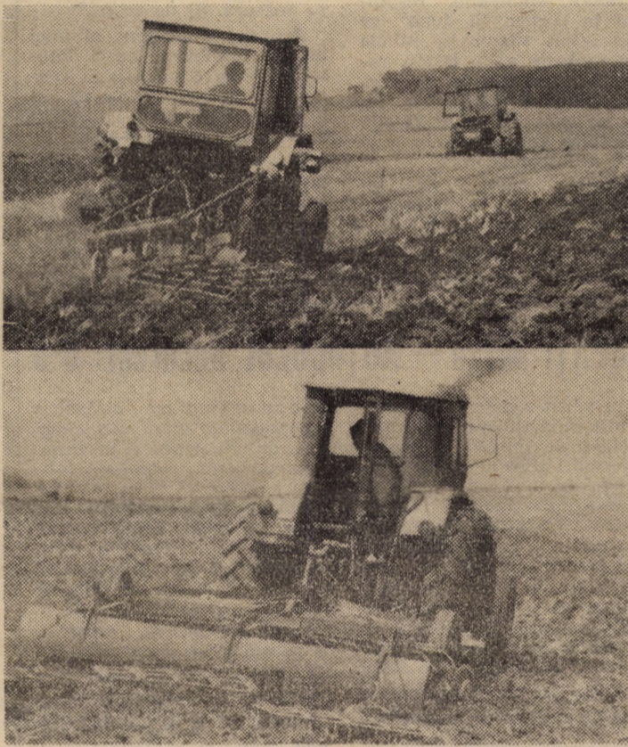
C.A.P. Cristian. În locul denumit „In răz” se lucrează intens la eliberarea terenului, efectuindu-se apoi aratul, discuitul, după care aici va fi însămînțat porumb cultură dublă.