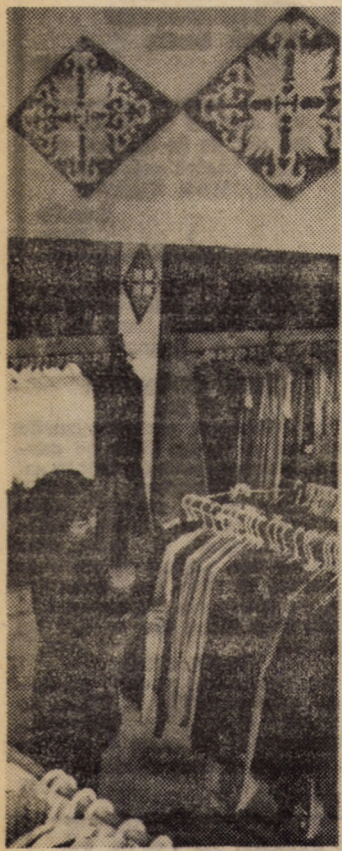
Din interioarele noului complex comercial „Transilvania” deschis recent în orașul Dumbrăveni.

Starea de dezordine și neclaritate în evidente este determinată și de efectuarea unor inventare formale, fără a se verifica existența reală a bunurilor. În inventarul de predare a balastierii Bradu-Olț de către Întreprinderea de exploatare industrială a agregatelor minerale de construcții Tirgoviste către I.C.M.J. Sibiu, de pildă, s-a constatat că 12 utilaje — menționate negru pe alb în inventar cu valoarea de 442 570 lei — lipsesc cu desăvîrsire desi sînt trecute ca existente! De asemenea, organele de procuratură constată și în prezent cazuri de încadrare sau menținere în funcția de gestionar a unor persoane cu antecedente penale, încălcîndu-se flagrant Legea nr. 22/1969. Acțiunile de verificare efectuate