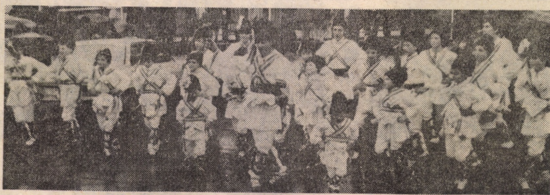
Formația de călușari din Rășinari - sau perpetuarea tradiției prin virste

Bivnac de corturi - în zilele de 2-3 iulie - în Săua Șteflești parcurgînd pînă la locul de campare traseul Păltiniș - Vf. Cindrel. („Excelsior” - D.J.P.Tc.). A doua etapă a concursului „Ștafeta cabanelor Făgărașului” (constind în parcurgerea traseului dintre cabanele Negoiu - Podragu cu puncte de viză în Vf. Negoiu și Vinătoare), este anunțată pentru perioada 3-17 iulie a.c. (A.S. Carpați Mirsa - „Veniiți cu noi”).