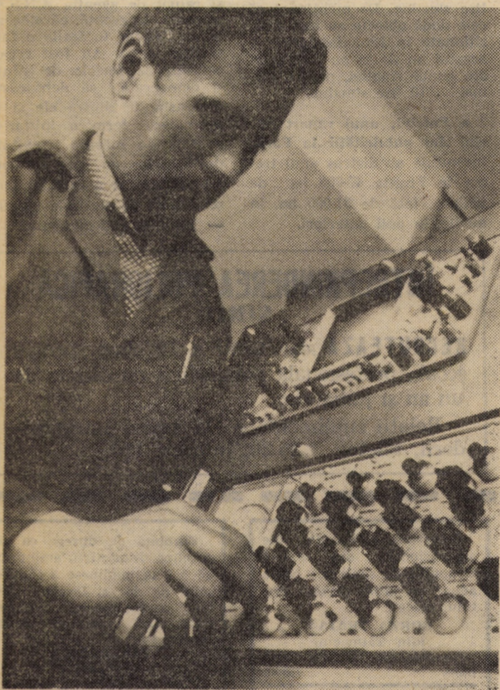
Comportarea diferitelor produse în regim de exploatare, realizate de întreprinderea de piese auto Sibiu, este urmărită cu ajutorul unor aparate sensibile din laboratorul de fiabilitate, capabile să depisteze cele mai mici defecțiuni.