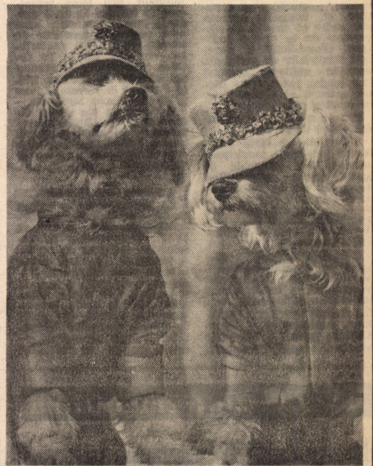
„Disputa” s-a încheiat