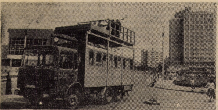
Zilele trecute în Piața Unirii din Sibiu am surprins pe pelușă o imagine din timpul instalării liniilor electrice de troleibuz, de către echipe specializate ale I.J.T.L.S.