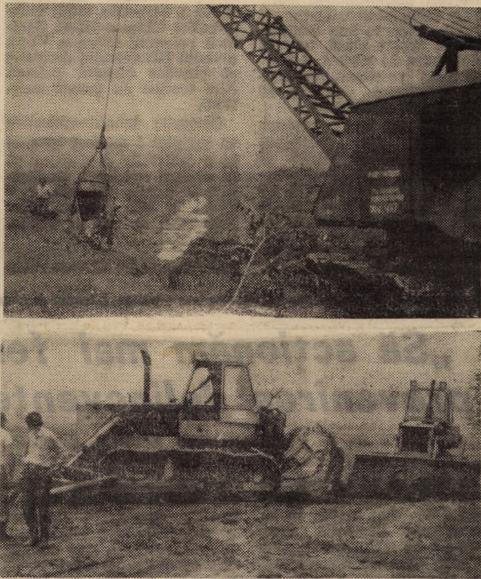
Amplă mobilizare de forțe mecanice la executarea lucrărilor de desecare în zona Avrig-Scorei

(Continuare în pag. a III-a) Nicolae IVAN