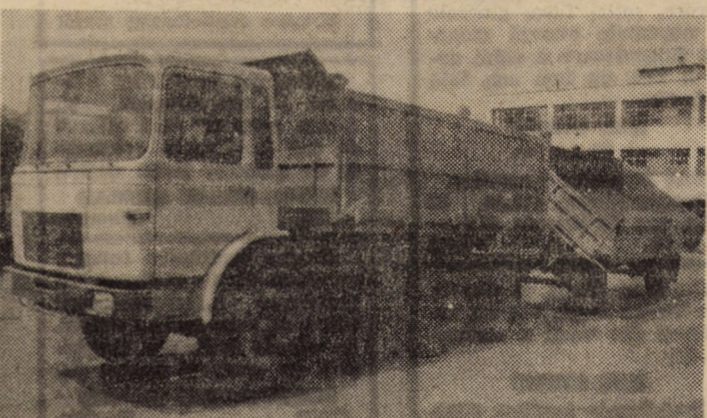
Autotrenul pentru transportat cărbune, compus din autobasculanta 19 215 DFK, cu trei poziții de basculare, și remorca RM-13, avînd volumul benelor de 13 și, respectiv, 8 metri cubi. Ambele poartă marca reputei I.M. Mirșa