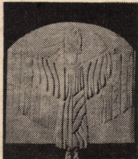
„Revelatia lui Dante”

Expoziția având caracter biennial își propune să circumscrie plastic opera florentinului Dante. Edițiile din urmă au fost dedicate capodoperei „Divina come-