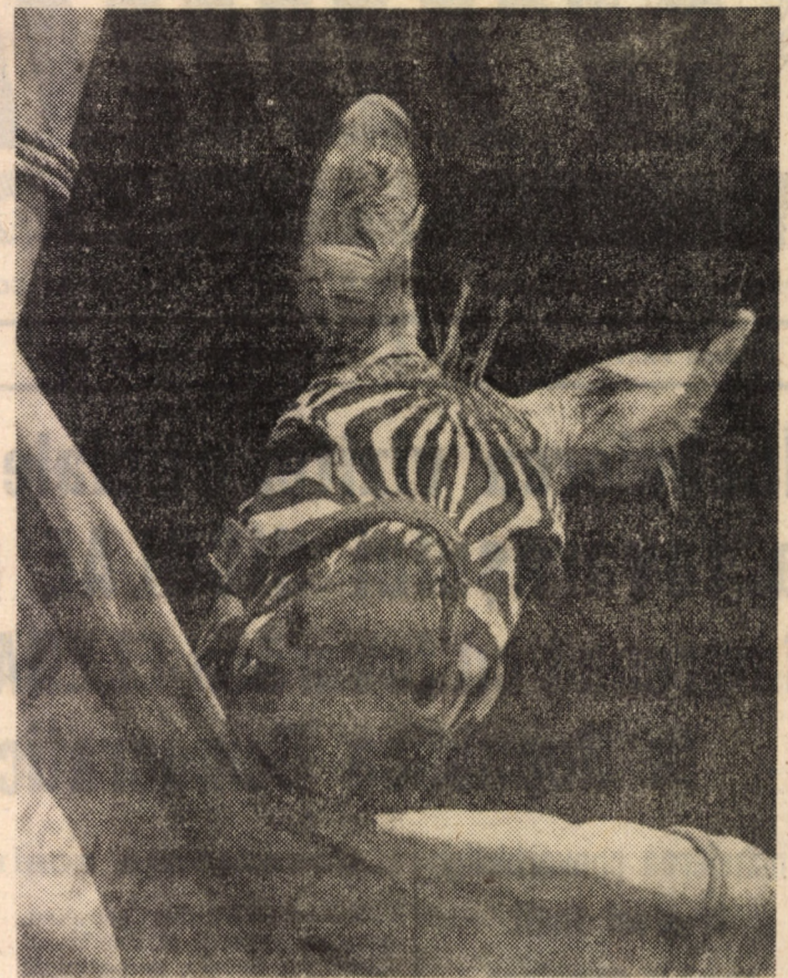
„În așteptarea admiratorilor”