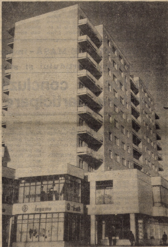
Noul cartier medieșean „După zid” — o imagine sugestivă a amplului program de înnoire arhitecturală a municipiului de pe Tîrnava Mare