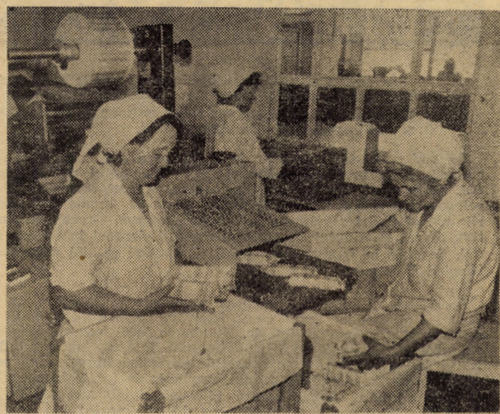
Întreprinderea „Victoria” Sibiu. În secția napolitană, procesul de ambalare a produselor este în bună parte automatizat.

Într-o atmosferă de puternică însufletire și angajare patriotică, participanții au adoptat textul unei telegrame adresată Comitetului Central al partidului, tovarășului Nicolae Ceausescu, secretar general al partidului.