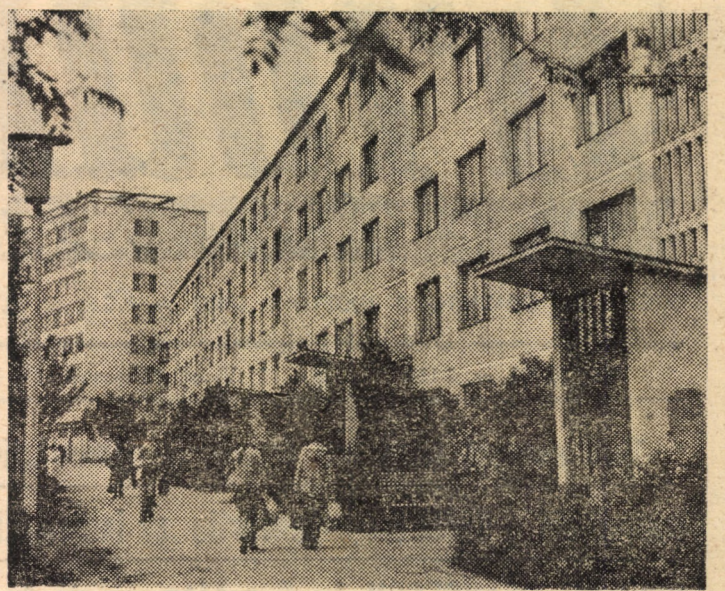
Secvență urbanistică sibiană.

11,00 Telex. 11,05 Panoramic economic. 11,35 Roman foileton: În vîltoarea vieții. Episodul 5. 12,25 Moment folcloric. 12,35 Ecran de vacanță. Desene animate. Povestiri din Pădurea Verde. 13,00 Închiderea programului. 16,00 Telex. 16,05 Festivalul național „Cîntarea României”. 16,25 Televacanță studentescă... 16,50 Clubul tineretului. 17,30 Carnet cultural. Omagiu zilei de 23 August. 17,50 1001 de seri. 18,00 Închiderea