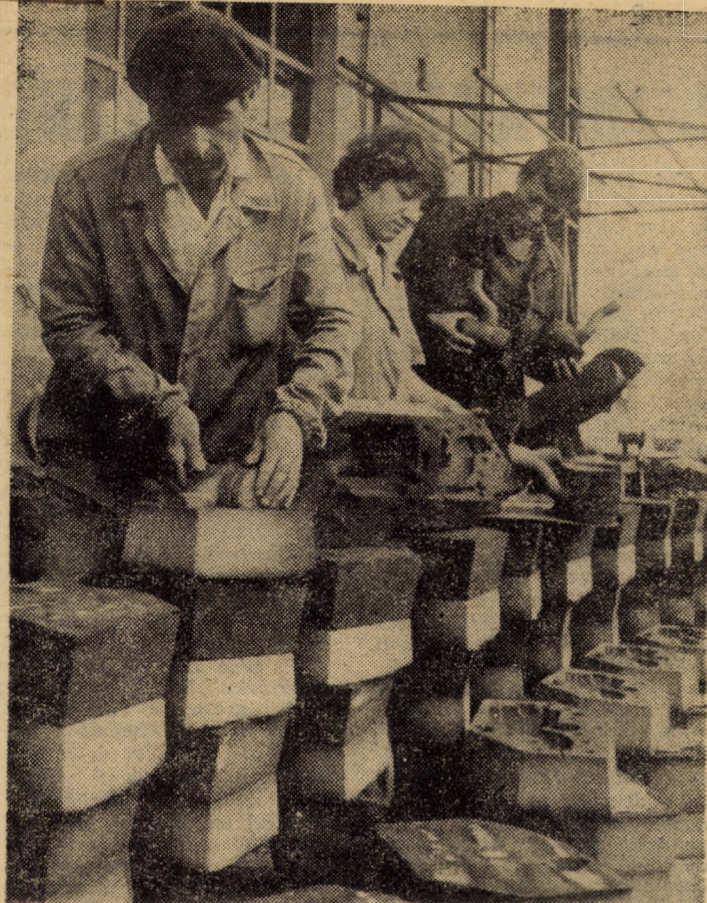
Secția turnătorie a întreprinderii „Metalurgica” Sibiu: pregătirea formelor în vederea turnării diferitelor repere pentru autocamioanele Roman Diesel

(Continuare în pag. a III-a) Rudolf KAMLA