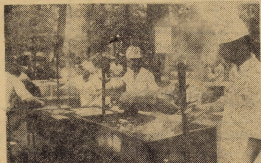
Instantanee din Dumbrava Sibiului