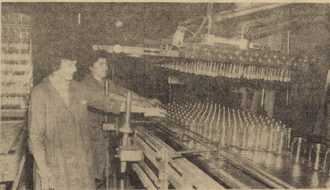
Întreprinderea „Vitrometan” Mediaș; imagine din secția sticlărie de ambalaj - fruntașă în întrecerea socialistă