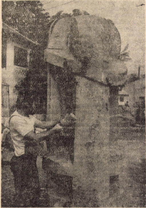
Artistul și... „Matca” sa.

Absolvent al Institutului de arte plastice „N. Grigorescu” — 1981, clasa Vladimir Predescu. Participă la expoziții de grup și republicane, la tabăra de la Măgura (1982). A