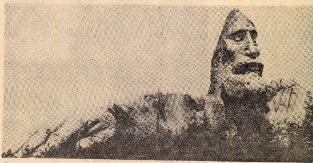
Radu Aftenie — Burebista — piatră (Măguro). Sculptorul a lucrat luna trecută în tabăra de la Săliște