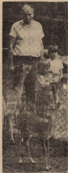
Vă invităm la grădina zoologică din Dumbrava Sibiului