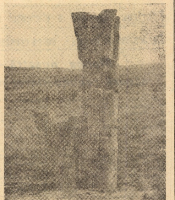
IMRE GYENGE - ODĂ PĂCII. (Săliște '83). - Un cor de copii străjuit cu grijă maternă într-un altar al artei din Poiana Soarelui (R.B.)