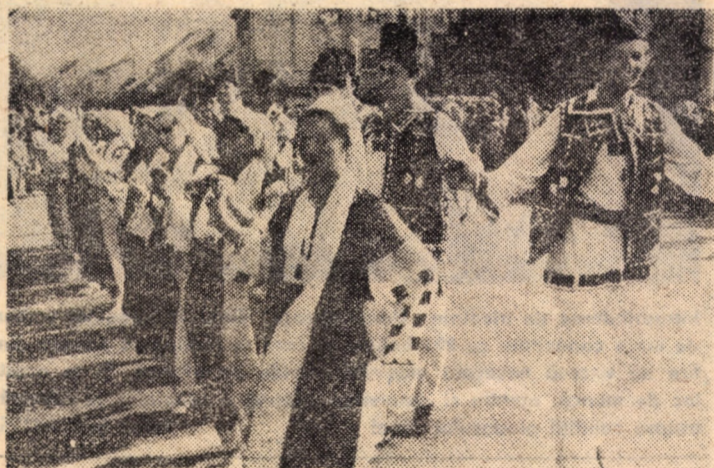
Razele soarelui au scinteiat, dar s-au topit cu umilintă în neasemuit de desfășurată pe străzile din centrul Sibiului