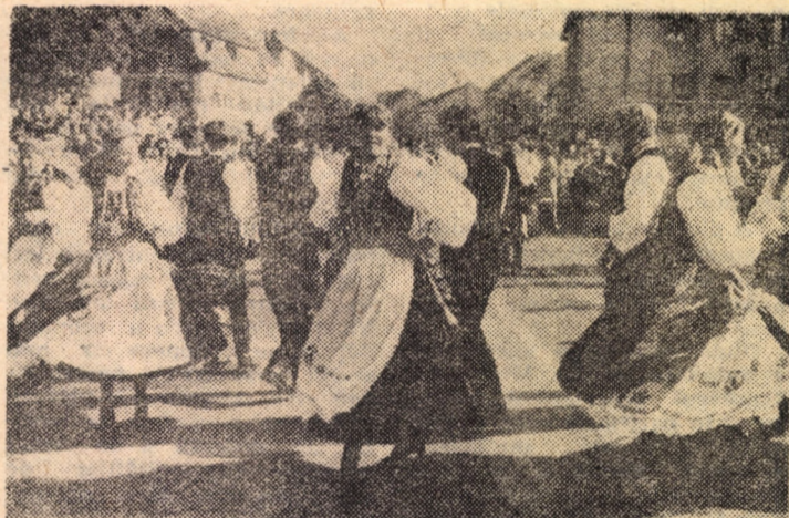
de frumoasele costume ale participanților la parada portului popular, Foto: Horst BUCHFELNER