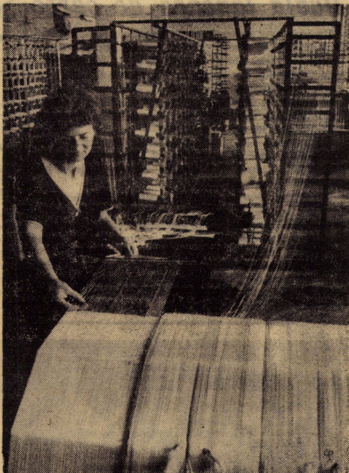
Întreprinderea de tricotaje „Drapelul roșu” Sibiu. În imagine: urzitor de mare capacitate cu 291 bobine la care se realizează urzeala din fire de viscoză necesară mașinilor rapide de tricotate. Și la acest loc de muncă, atenția și deservirea corectă a utilajelor se reflectă asupra calității produsului final