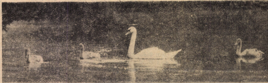
Printre noii „pensionari” ai grădinii zoologice din Dumbrava Sibiului figurează și cei trei pui de lebădă (din fotografie) al căror penaj este deocamdată de culoarea cenușie