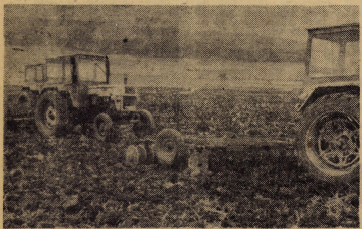
La C.A.P. Șura Mică, imediat după eliberarea terenurilor se acționează pentru pregătirea patului germinativ în vederea însămînțării griului.

Toate lucrările de sezon, executate în limitele termenelor stabilite!