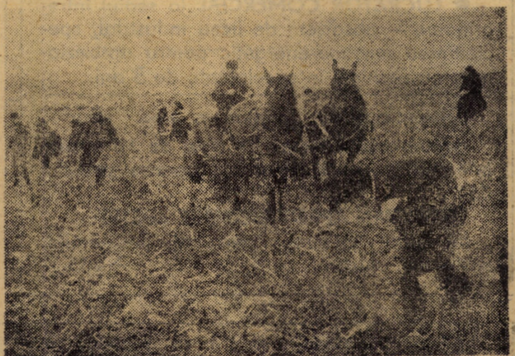
În urma combinelor, cooperatorii string fiecare știulete de porumb rămas pe cîmp