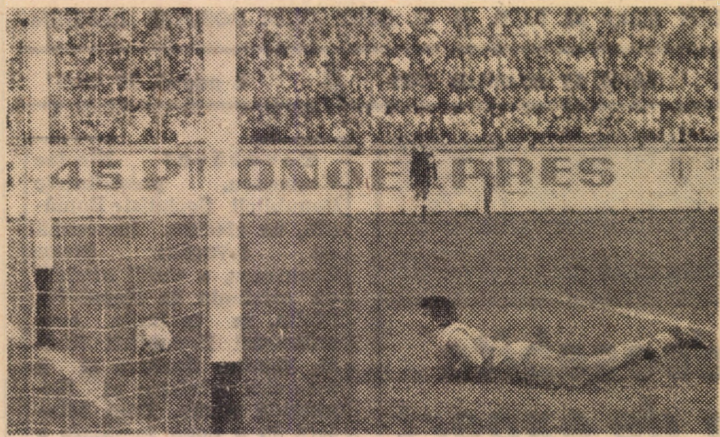
Minutul 30: 1-0 pentru Șoimii...