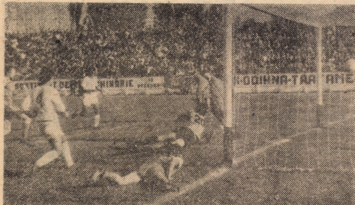
Momentul deschiderii scorului