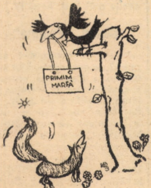
Fără cuvinte Desen de Adrian POPEȘCU

Vertical: 1) Pară — A da fructe. 2) Gem de fructe! (dim.) — Cireșar (presc.). 3) Stau lângă un măr! — Portocal (inv.). 4) Fructe vîrătoare — Sere — Dig spart! 5) Secure mică — Partere! — Ape! 6) Bobițe... de peste! — Centru pomicol în județul Alba. 7) Stat sud-american — Desis cu afine. 8) Cană! — Poame acre... 9) ... care îți lasă un gust amar (pl.) — Nu-i pe toate drumurile. 10) Fruct înaripat — Bere engleză. 11) Fructele arinului — Fruct de culoare galbenă-portocalie, gustos și parfumat (pl.). 12) Arbore rășinos care poate trăi peste o mie de ani — Mlădițe de viță-de-vie. George MARINĂ