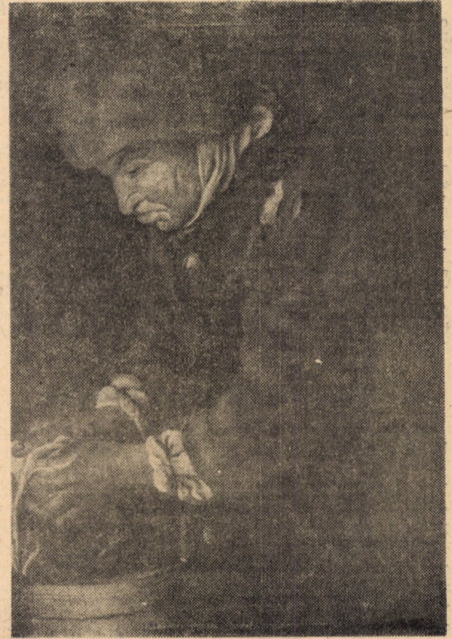
Identificată de curînd de muzeografa Olimpia TUDORAN, lucrarea „Spălătoreasa”, poartă semnătura pictorului italian Pietro Bellotti, sec. XVII