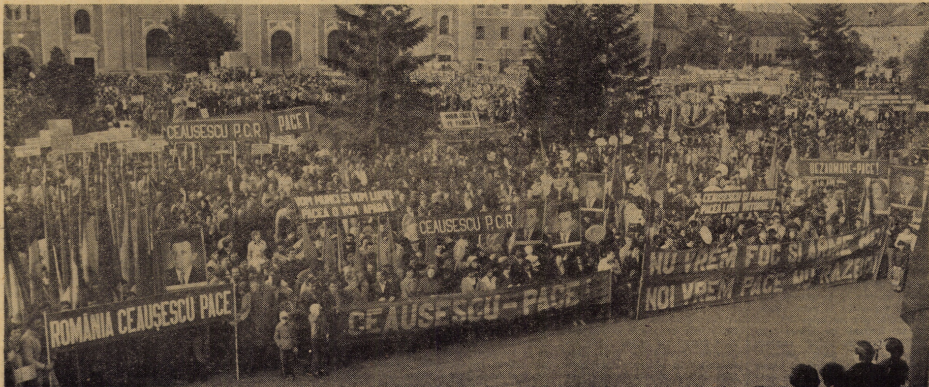
Imagine de la adunarea locuitorilor din municipiul Sibiu, consacrată păcii și dezarmării