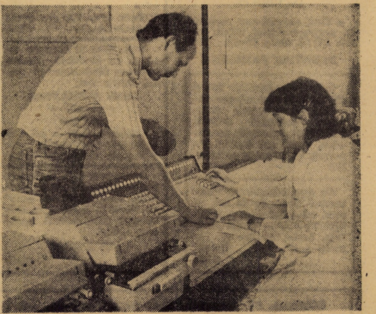
Extinderea utilizării mijloacelor moderne de calcul și evidență constituie una din preocupările cotidiene ale colectivului întreprinderii de ciorapi „7 Noiembrie“ Sibiu

Rubrică realizată de Sorin CRIVĂȚ, (cu sprijinul serv. circulație al Miliției jud. Sibiu)